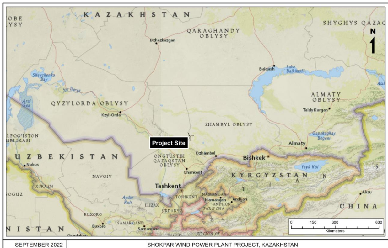
Рисунок 1 – Расположение Шокпарской ВЭС в Жамбылской области

Проект ВЭС направлен на обеспечение региона устойчивым источником возобновляемой энергии и содействие достижению Казахстаном Установленных на национальном уровне целевых показателей вклада. В долгосрочной перспективе предполагается увеличение доходов и местного бюджета, а также повышение общей надежности энергоснабжения региона.