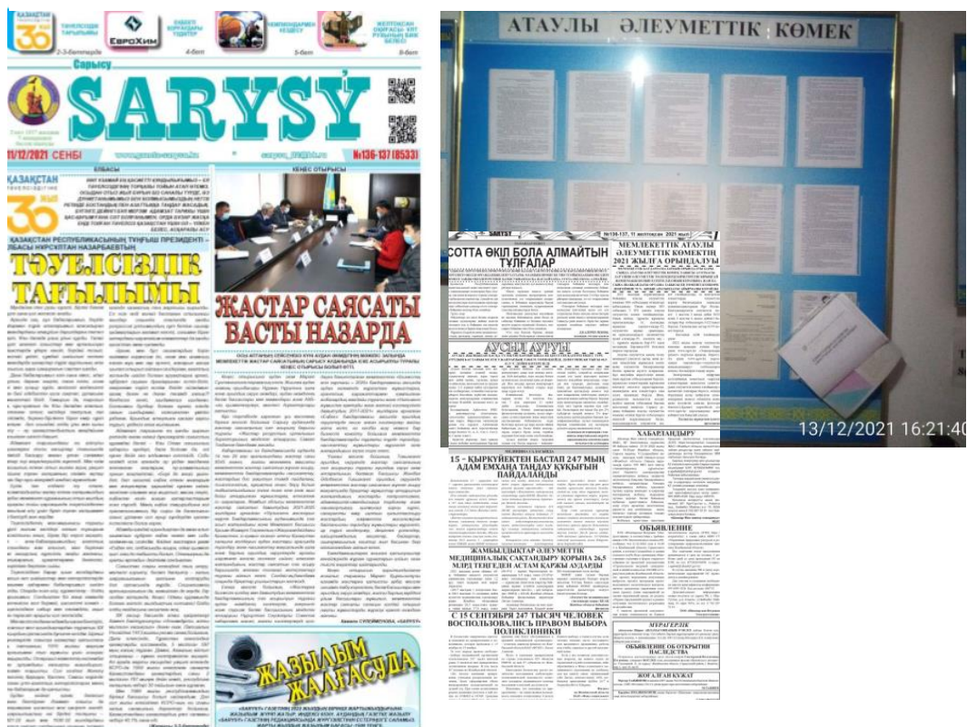
Рисунок 3 – Объявления о публичных обсуждениях ОВОС Шокпарской ветровой электростанции мощностью 100 МВт

Как сообщалось, ТОО «Шокпарская Ветровая Электростанция» планирует создать веб-сайт с указанием контактов, а также страницу в социальных сетях, чтобы жители могли наблюдать за ходом строительства и задавать свои вопросы.